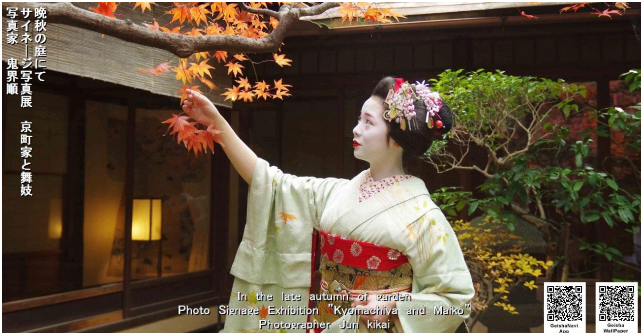
In the late autumn of garden Photo Signage Exhibition "Kyomachiya and Maiko" Photographer Jun kikai